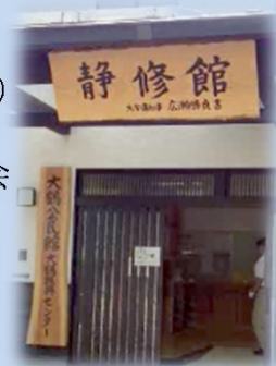
研究会の会場となった大鶴振興センター静修館の玄関