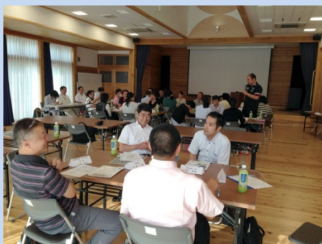
グループ討議のまとめを発表する様子 手前のグループが理事のみなさんです

本日の研究会に参加された皆様方の様々な思いを、5つのグループに分かれて討議が行われました。センターの方々にもオブザーバーとして各グループに入って頂きました。