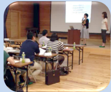
学習療法のすばらしさを熱く語るセンテナリアンのお二人

入所時の短期集中プログラムとして学習を3ヶ月実施。この間はFAB/MMS Eは維持できていたが、短期集中が終了後、加齢により徐々にFAB/MMS Eが低下し、昼夜逆転や引きこもりとなる。ご家族も「このままでは死んでしまう。自分のところに連れて帰ろう」とまで考えることに。そこで、学習リーダーが「遊びに来ませんか？」とお誘いしたところ、学習することを大変喜ばれました。ご家族も元気になるのならと学習を開始。今では施設の「盛り上げ隊」隊長！